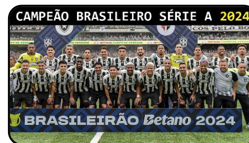
Figura 2: Elenco da equipe principal do Botafogo, campeão do Campeonato Brasileiro da Série A de 2024

A sede social do clube está localizada no bairro de Botafogo, na zona sul do Rio de Janeiro, enquanto as partidas de futebol são