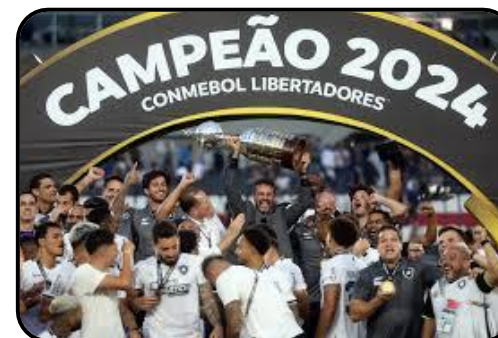
Figura 1: Comemoração do Título da Copa CONMEBOL Libertadores

Garrincha, Nilton Santos, Jairzinho e Didi fazem parte do legado do Botafogo.